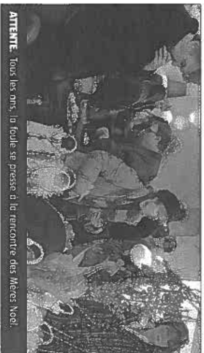
ATTENTE. Tous les ans, la foule se presse à la rencontre des Mères Noël.

Les artisanes d'arts, bien connues du public avallonnais exposent samedi 4 et dimanche 5 décembre, dans la salle du camping de Saint-Père. « Les Mères Noël » est une opération lancée dans les années 80 par l'ex-réalisateur de émissions culturelles pour la télévision, Yvon-